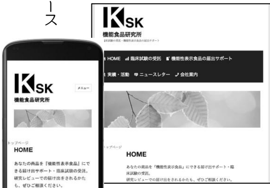
新しい弊社ホームページ

このホームページにはどんなコーナーがあるかという事が解るメニューの選択肢を文字からボタンに変更し『臨床試験の受託』『機能性表示食品の届出サポート』『実績・活動』『ニュースレター』『会社案内』と表記しました。