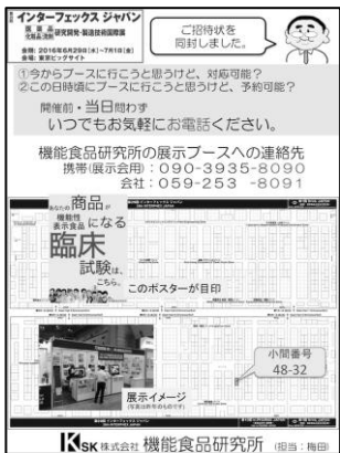
先月号の同封チラシ

先月号は、『ご所属や住所などが変わられた方にお書きいただくFAX用紙を同封した結果、多くのFAXをいただいた事』と『展示会(インターフェックスジャパン)の弊社展示ブースの場所と連絡先の電話番号を記載したチラシの作成・同封しました』というお話でした。皆様から「FAX用紙、確かに一筆書きスペースがあると良いですね。」「展示会のブース位置の地図、分かりやすかったですよ。」「展示会当日、ブース担当者さんに電話で「今から〇〇分後へらうに行くと、来客中?」「みたいに確認してから行くのは便利。」「というお言葉を寄せいただきました。皆様からお言葉をいただける事、励みになっております。ありがとうございます。」