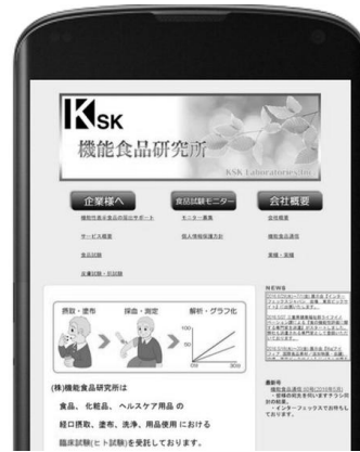
従来のホームページ

従来のホームページでは以下の①～⑪の行程と測定項目の説明や試験デザインの作り方などを「経口摂取する試験」で1枚、「塗布する試験」で1枚の計2枚のページに詰め込んでありました。もっと詳細を書き込みたかったのですが、見辛くなってしまっただけです。今回は経口摂取と塗布の一覧表を共通の1枚にまとめ、各項目の詳細説明ページに移動出来るようにしました。