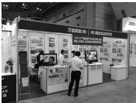
展示ブースイメージ(昨年の写真)

この『カレンダーを見ながら』というの理由はありまして、いつもお世話になっているお客様から「展示会に行く予定があるから水曜13時頃に行くよ。会場に着いたら電話しますね」など複数のお約束がございましたため、その時間と重複していない事の確認です。このように毎年、弊社展示ブースまでお越しいただけるといってお話を複数いただいております。